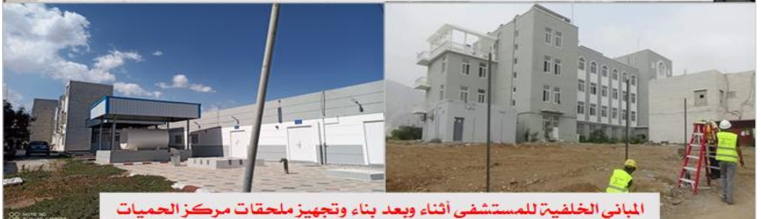
المباني الخلفية للمستشفى أثناء وبعد بناء وتجهيز ملحقات مركز الحميات