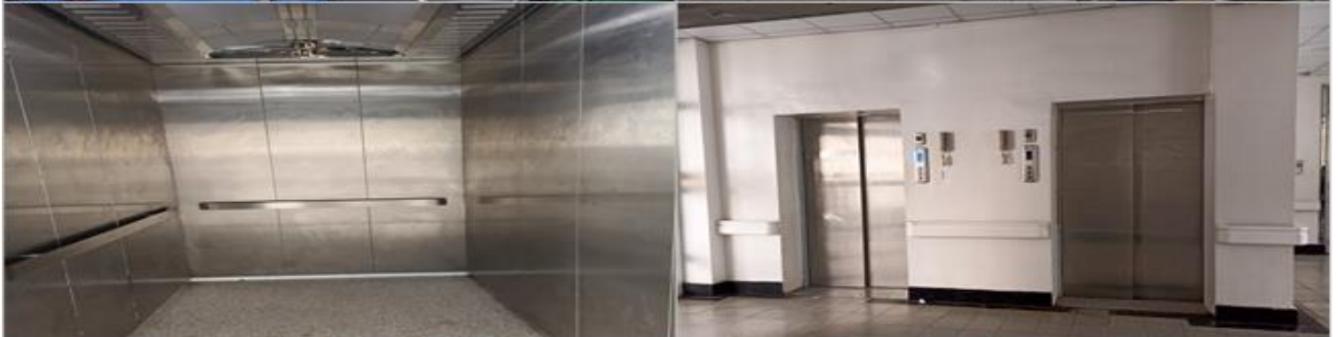
تركيب عدد ٧ مصاعد اربعة ادوار في مبنى الرقود والعمليات الكبرى وإعادة تأهيل وإصلاح مصعد ثالث في مركز الطوارئ