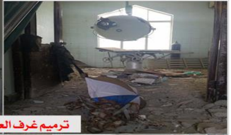
ترميم غرف العمليات الكبرى