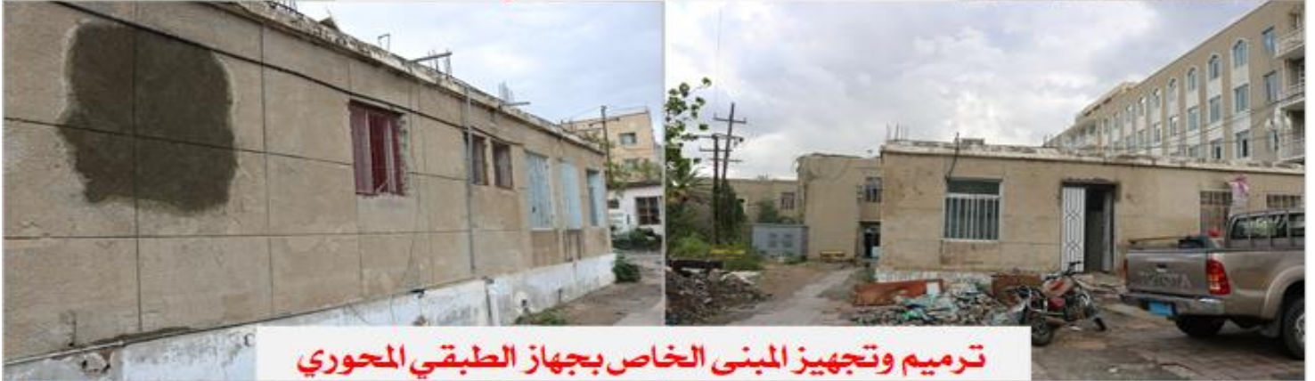
ترميم وتجهيز المبنى الخاص بجهاز الطبقي المحوري