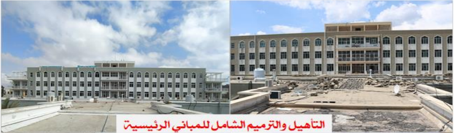
التأهيل والترميم الشامل للمباني الرئيسية