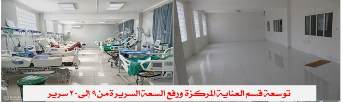
توسعة قسم العناية المركزة ورفع السعة السريرية من ٩ إلى ٢٠ سرير