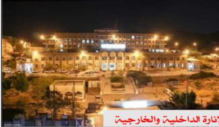
إصلاح وتأهيل شبكة الإنارة الداخلية والخارجية