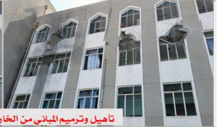
تأهيل وترميم المباني من الخارج بعد استهدافها أثناء الحرب