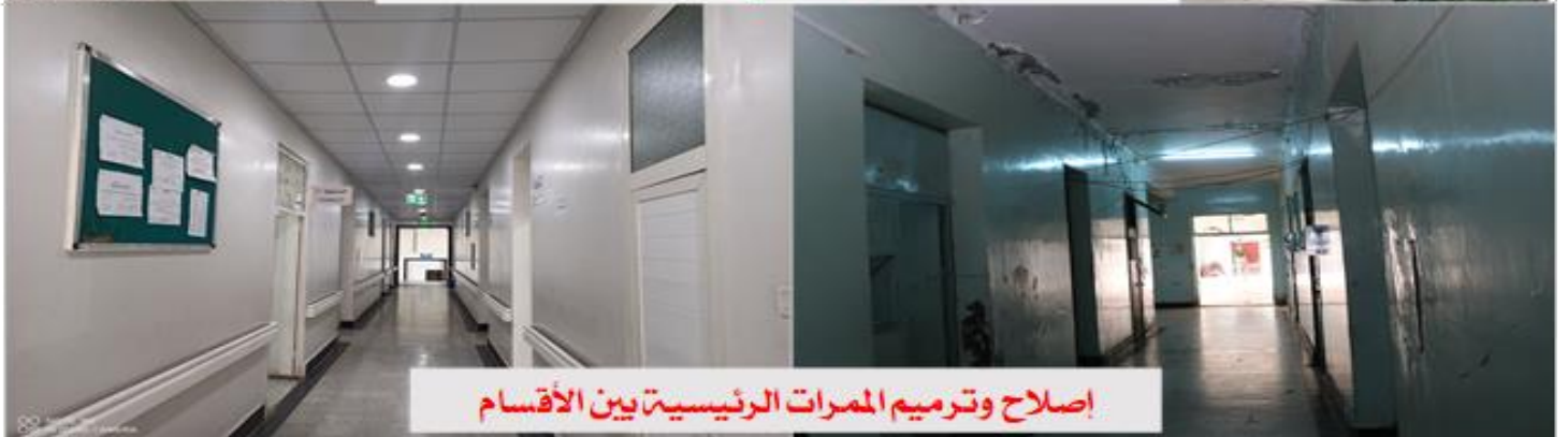
إصلاح وترميم الممرات الرئيسية بين الأقسام