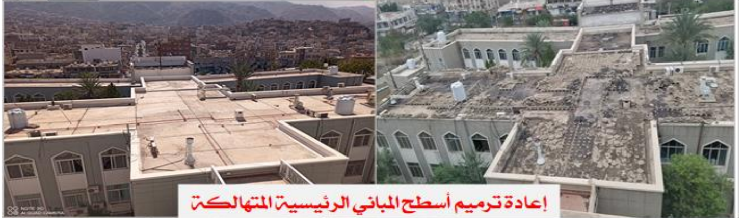
إعادة ترميم أسطح المباني الرئيسية المتهاكّة