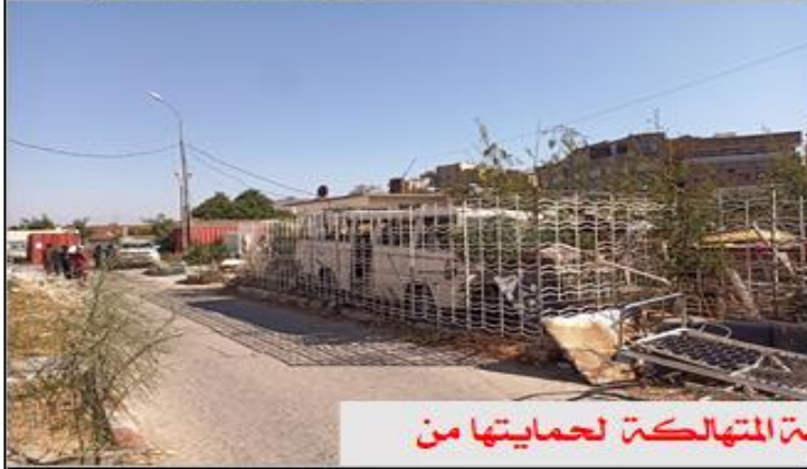
ترتيب وتجميع صول الهيئة المتهاككة لحمايتها من