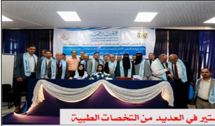
افتتاح برامج الزمالة اليمنية والمجستير في العديد من التخصصات الطبية