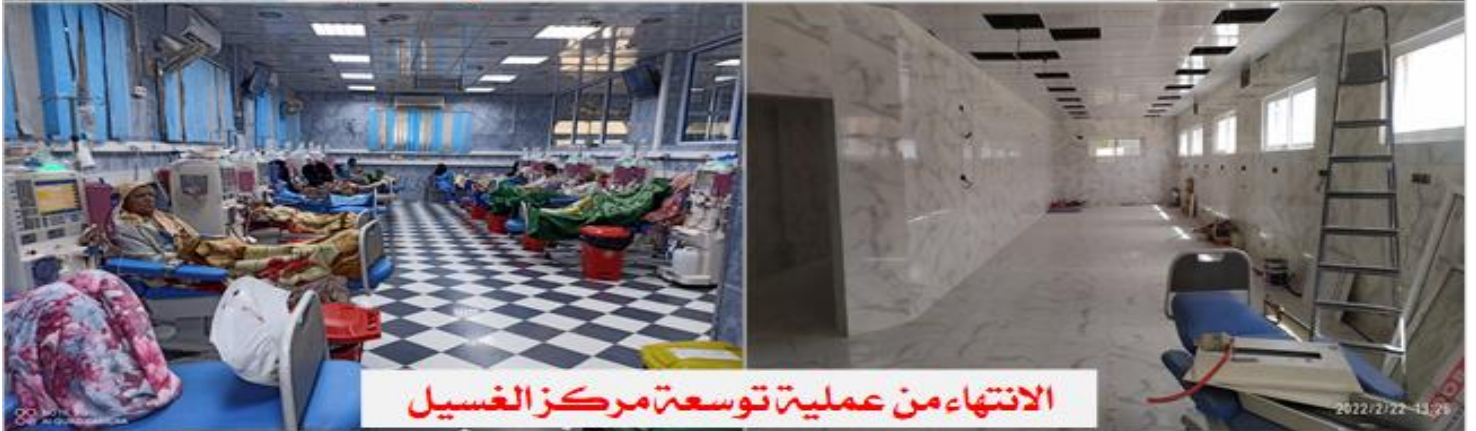
الانتهاء من عملية توسعة مركز الغسيل