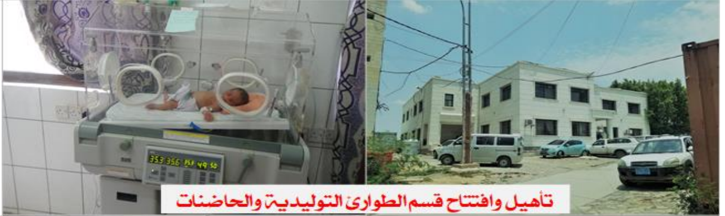
تأهيل وافتتاح قسم الطوارئ التوليدية والحاضنات