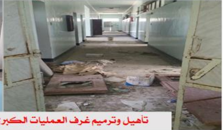
تأهيل وترميم غرف العمليات الكبرى وحاليا تجري عملية التأسيس لغرف