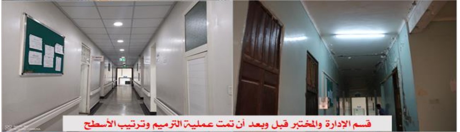
قسم الإدارة والمختبر قبل وبعد أن تمت عملية الترميم وترتيب الأسطح