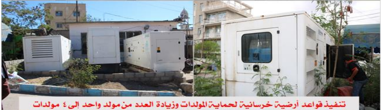
تنفيذ قواعد أرضية خرسانية لحماية المولدات وزيادة العدد من مولد واحد إلى ٤ مولدات