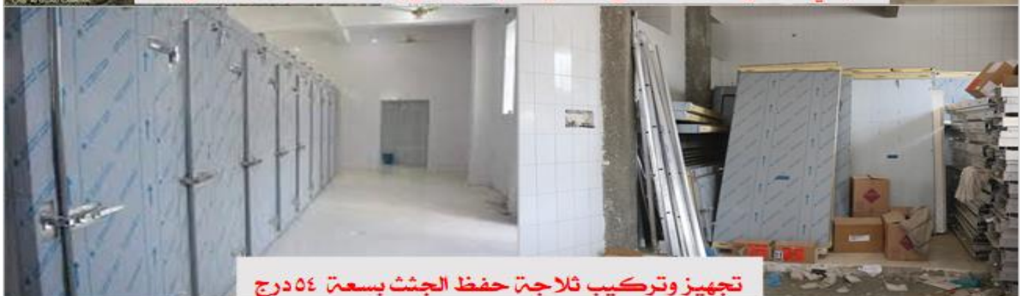
تجهيز وتركيب ثلاثية حفظ الجثث بسعة ٥٤ درج