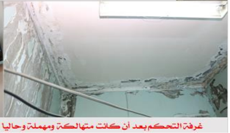
غرفة التحكم بعد أن كانت متهاكّة ومهملة وحاليا بعد أن تم تأهيلها وادخال شبكة مراقبة من ١٠٠ كاميرا