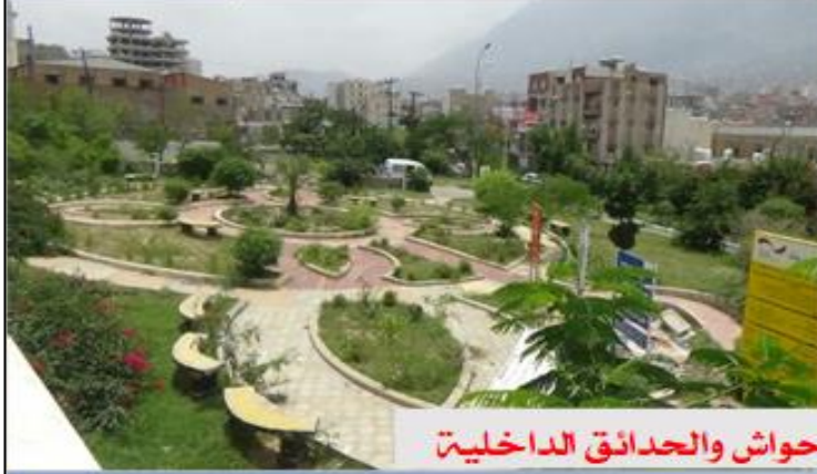
تأهيل وتشجير بعض الأحواش والحدائق الداخلية